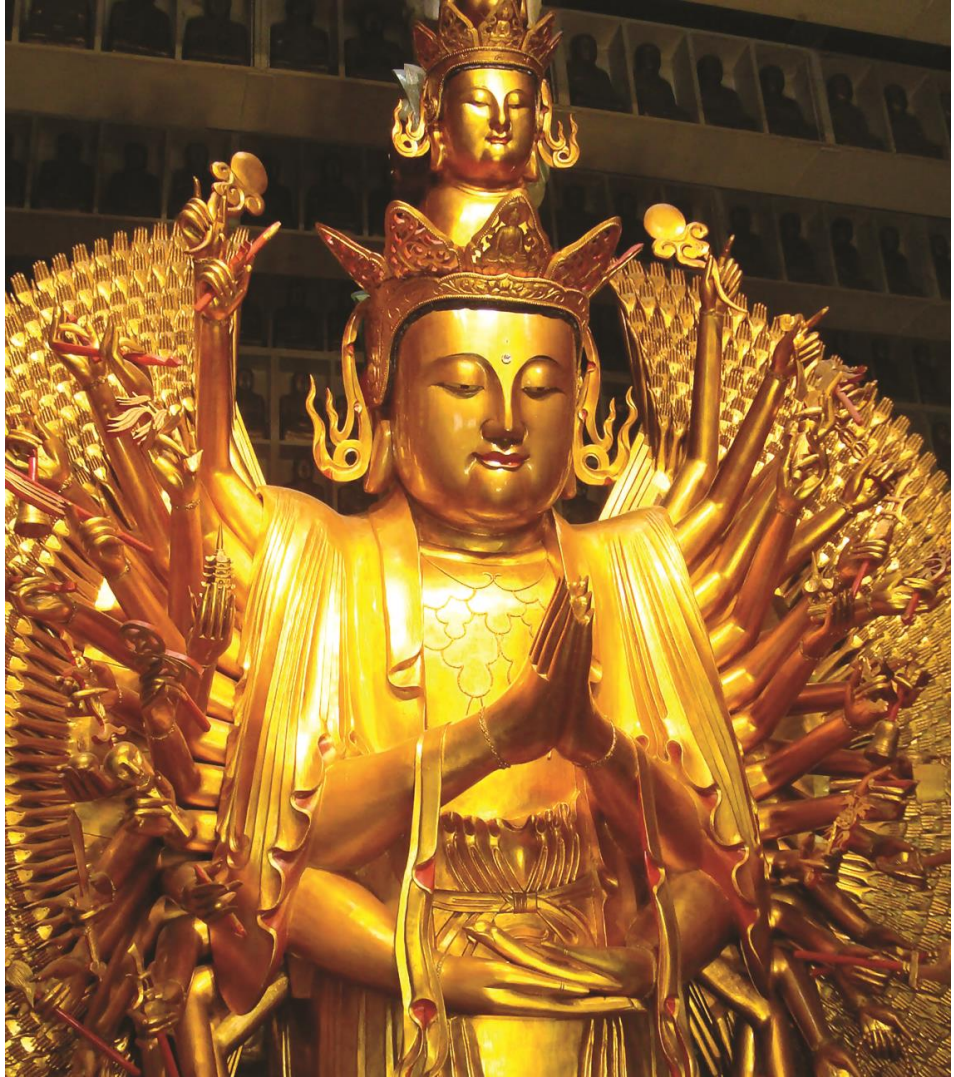
Thiên Thủ Thiên Nhãn Đại Từ Đại Bi Quán Thế Âm Bồ Tát