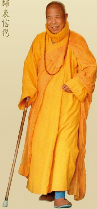
Hòa thượng Tuyên Hóa