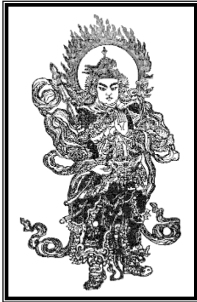
Nam Mô Hộ Pháp Vi Đà Tôn Thiên Bồ Tát