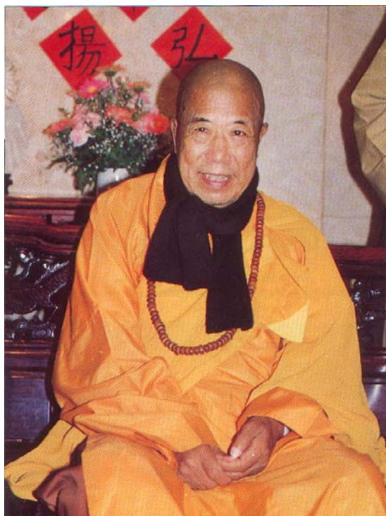
HOÀ THƯỢNG TUYÊN HOÁ